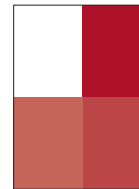
1/2 side • højformat • tværformat