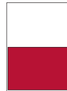
1/2 side • tværformat